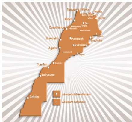
Aéroports du Maroc